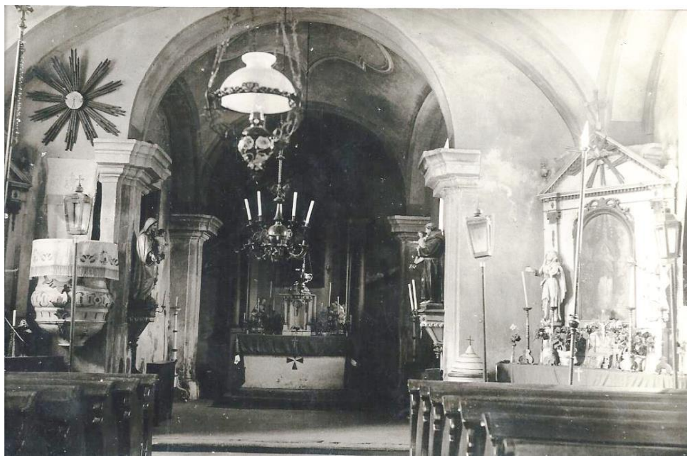
POSLEDNÁ SV. OMŠA BOLA SLÁVENÁ PRAVDEPODOBNE 28. SEPTEMBRA 1935